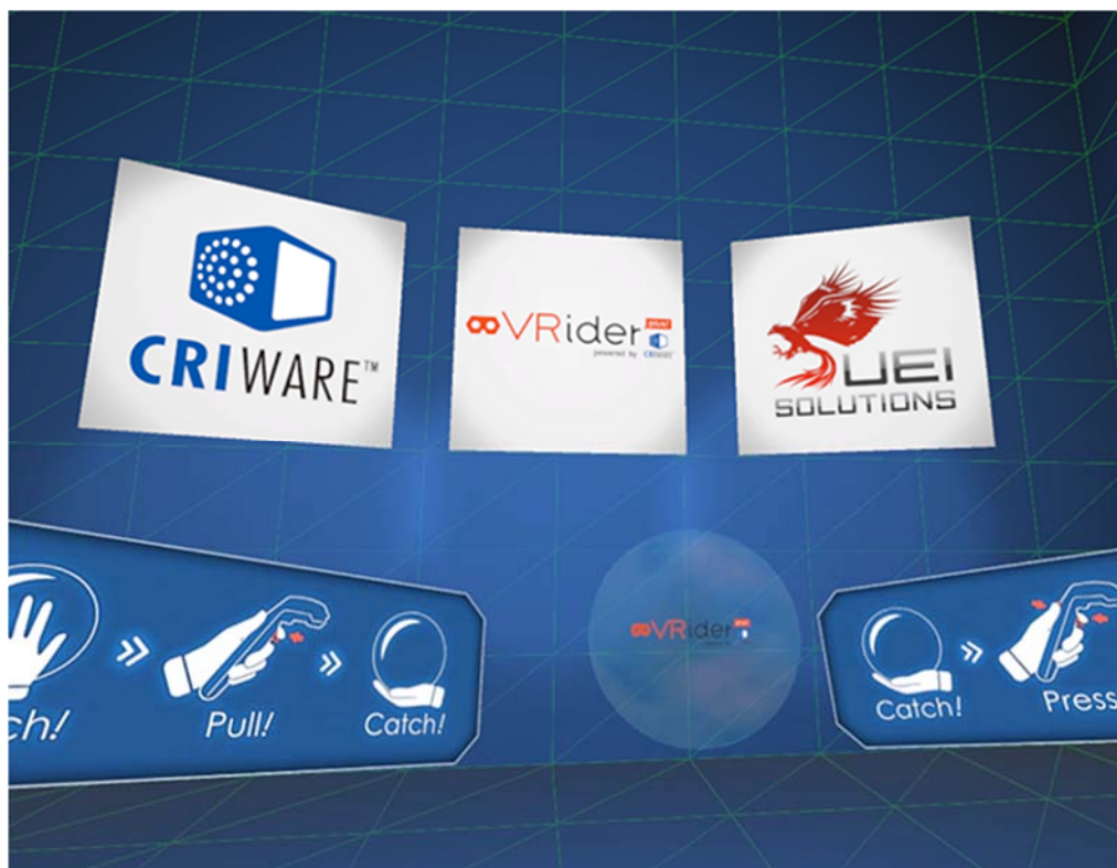
VRider plus Powered by CRIWARE デモ画面